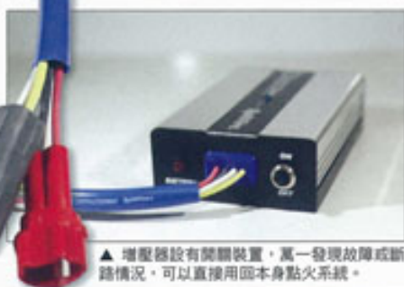
▲ 增壓器設有開關裝置，萬一發現故障或斷路情況，可以直接用回本身點火系統。