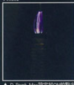
▲ D Spark Max設定於ON的點火情況