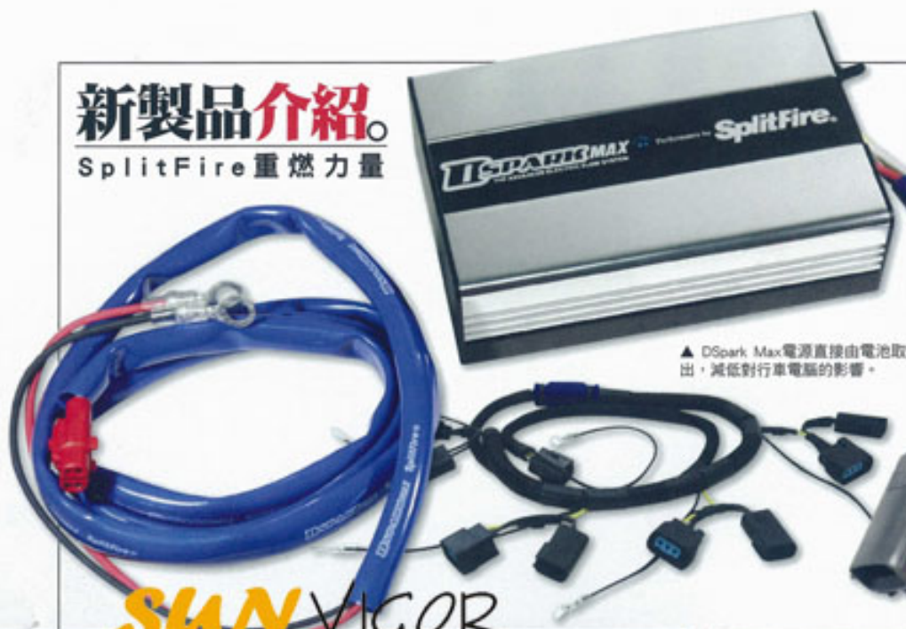
▲ D Spark Max 電源直接由電池取出，減低對行車電腦的影響。