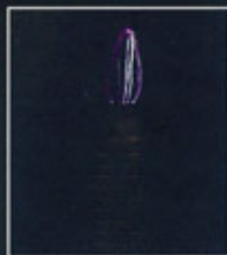
▲ D Spark Max設定於OFF的點火情況