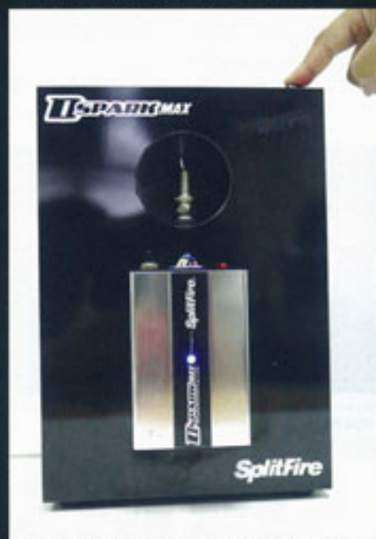
▲ 這一個裝置可以看得ON/OFF點火情況的分別。