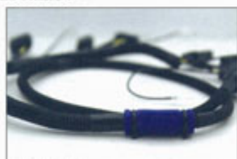
▲ 需要接駁原裝點火裝置的轉插，將電壓加強至點火器身上。