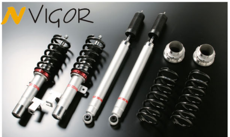
▲ AutoExe已推出了Mazda 5安裝使用的Type B高性能絞牙避震機。