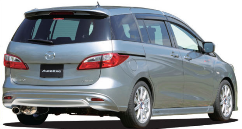
▲ AutoExe已為Mazda 5推出高性能不銹鋼排氣喉，以單鼓式設計，可直接提高排氣效率及扭力輸出，同時更可提升車身造型美感。

即將推出市場的新款Mazda 5(CW)，AutoExe廠方已在日本推出了一系列改裝零件給予它安裝使用，當中當然不少得有型有款的Body Kit、高性能避震機、排氣喉及車廂飾件等。☑