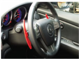
▲ 新款Mazda 5設有六速+/-波箱，而軟環設有轉波撥桿，AutoExe製作了一套賽車式轉波撥片給予Mazda5安裝使用。

頭泵把與中網設計一體化，令頭泵把具有一體化的性能又同時擁有層次感，革新時代創意之餘，新設計能提升引擎及迫力碟的散熱效能，加上前泵把下裙能產生更佳的下壓力，絕對是功能與外形同時兼備的產品。