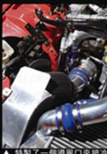
▲ 特製了一個導風口來把冷風導入Turbo的吸氣口。