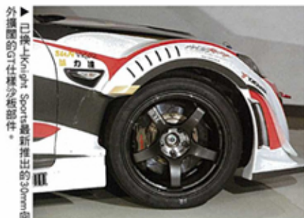
▲ 已裝上Knight Sports最新推出的30mm低外圍圈(GT)仕樣多板部。