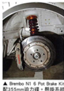
▲ Brembo N1 6 Pot Brake Kit 配355mm迫力碟。懸掛系統已換入Knight Sports強化部件，避震機方面選用上日本名廠Aragosta頂級絞牙避震機。