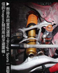
▲ 懸掛系統當然選用Top Gun Sports一直堅信的Apex Race Tech用鈦牙避震機。