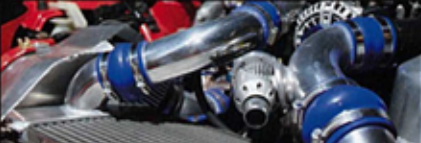
▲ Inter-Cooler同樣是以斜放V-Mount設計。