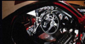
▲ 由一台街車改造而成的RX-7，車廂只作簡單的偷輕及追加了防滾架。