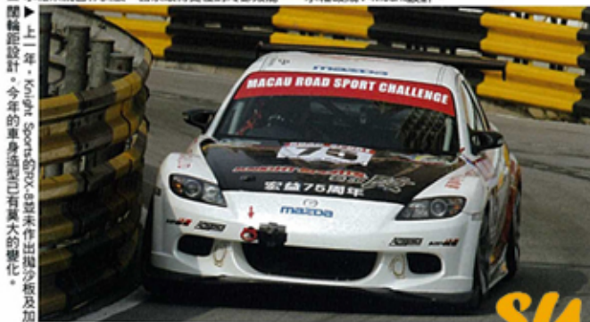
▲上一屆，Knight Sports的RX-8並未作出渦輪系統及加壓系統設計。今年的車身設計亦有更大的變化。