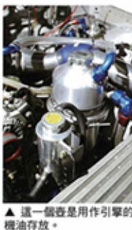
▲ 這一個壺是用作引擎的機油存放。