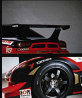
▲ 車尾加裝了一個Knight Sports車底擾流導風板，有助提升高速行車的穩定性。