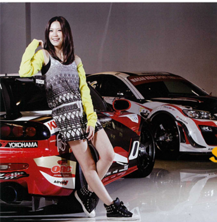
「一心」 ——龐大的宏益賽車隊，佔有絕大多數，大家士下