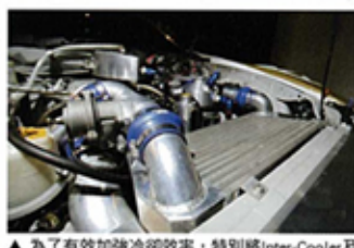
▲為了有效加強冷卻效率，特別將Inter-Cooler及水箱改成V-Mount設計。