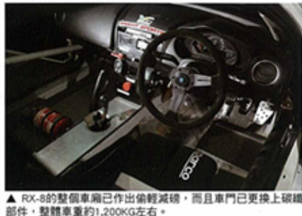
▲ RX-8的整個車廂已作出偷輕減磅，而且車門已更換上碳纖維部件，整體車重約1,200KG左右。

的冷卻效率，令油、水溫都長期保持最佳的工作狀態。 對馬力高達五百匹的RX-8，特別在車頭改裝了一套制動力強勁的Brembo N1 6 Pot Brake Kit配355mm迫力碟，而車尾就用4Brembo 4 Pot Brake Kit配340mm迫力碟，谷川達也表示就算在最高速的葡京灣前收車亦可穩定煞車，提供了安穩的煞車信心。RX-8可在水塘彎角及東方灣以極速攻入全有賴一套懸掛系統名牌Aragosta專為Knight Sports而特鑄的3 Way Type氮氣絞牙避震機，避震機心以倒Fork式設計，而且有氮氣棒作吸震緩衝，有著出色的吸震表現，令谷川達也可在松山路段操控更輕鬆靈活。