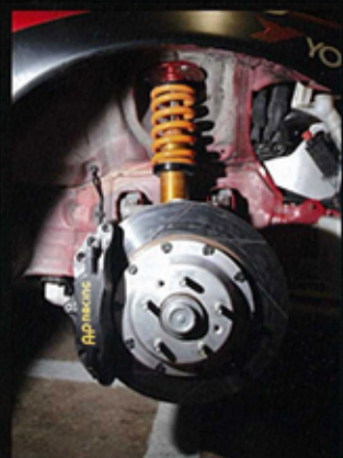
▲ 制動系統方面用上AP Racing 6 Pot Brake Kit配340mm迫力碟。