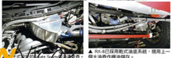
▲RX-8已採用乾式油底系統，現用上一個大油倉作機油儲存。