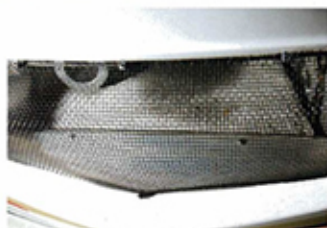
▲水箱系統已作斜放，務求取得最佳的冷卻效能。