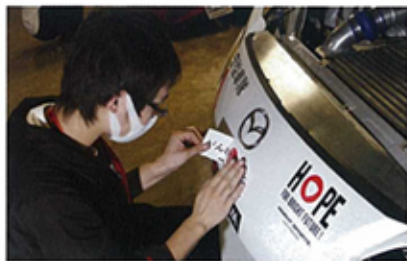
▲ 為支持日本311災難重建，Knight Sports戰車已貼上支持口號。