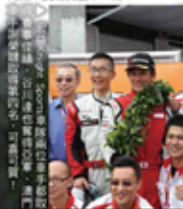
▲ 澳門宏益Knight Sports車隊在賽事後即時為兩位車手慶祝及拍攝留念。

大將之風 兩屆前Knight Sports的RX-8在排位賽中雖然發生意外，但仍趕及維修出賽，更奪得亞軍冠軍。全場亞軍一席，去年好可惜遺憾欠缺，在比賽起步後與三台戰車發生意外，宣告退下戰線，非常可惜！雖然戰車已撞毀，但Knight Sports車隊、車手及上下工作人員都沒有作出埋怨，筆者認為他們非常有大將之風。今年捲土重來，車隊特別為RX-8作出重新改裝，換上新戰衣及加闊輪距，務必要令高速彎道操控更靈活，隨時來加快圈速時間，天公造美今年路車挑戰賽Knight Sports的兩位車手爭奪亞軍一役！