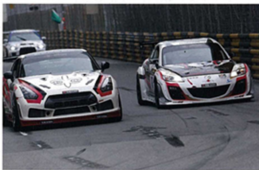
▲ 谷川達也表示R35 GT-R的車速的確很快！