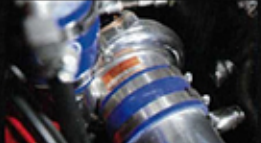
▲ T04 62-1型裝(吸氣口徑達76.2mm、排氣口徑62mm)。