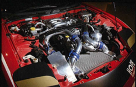
▲ RX-7身上的一副13B引擎的威力絕不比RX-8低，馬力達503.1ps！