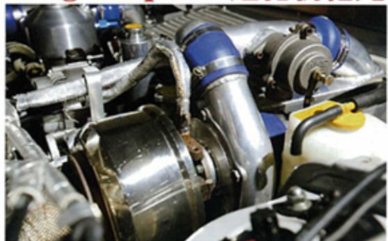
▲T048 60-1渦輪系統(渦輪的吸氣口徑達76.2mm，而排氣口徑達59mm)。