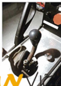
▲ Hewland SGT 6 速直牙波箱系統，再配4.7尾牙，令RX-8在直路爆發強勁的加速。